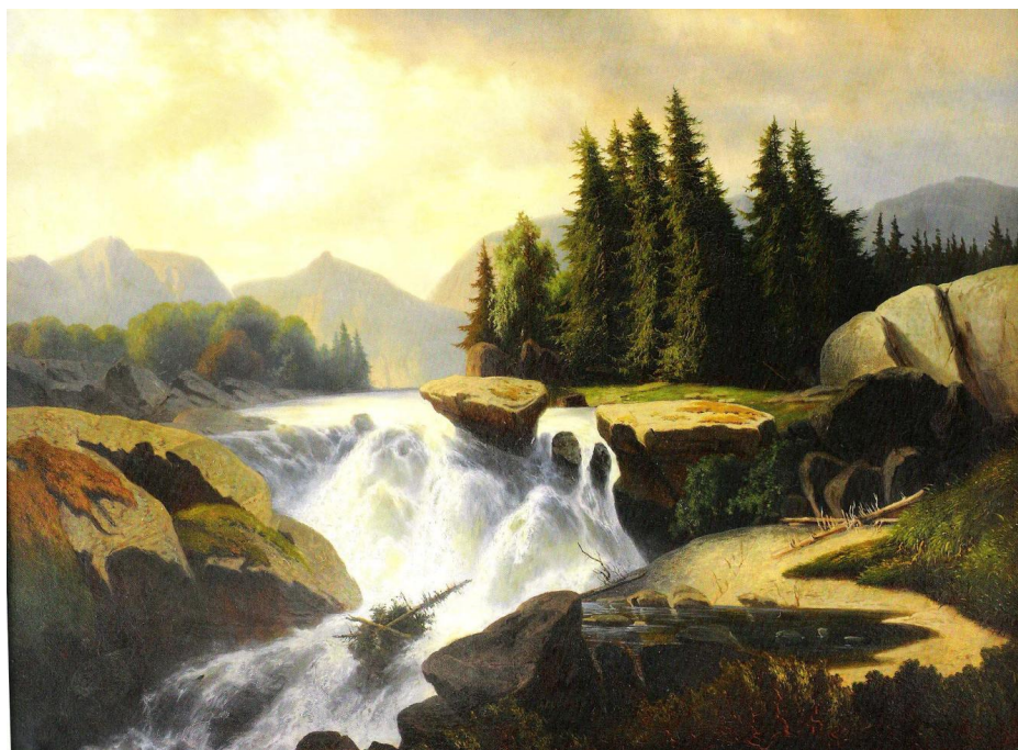
Alexandre Calame, Rivière