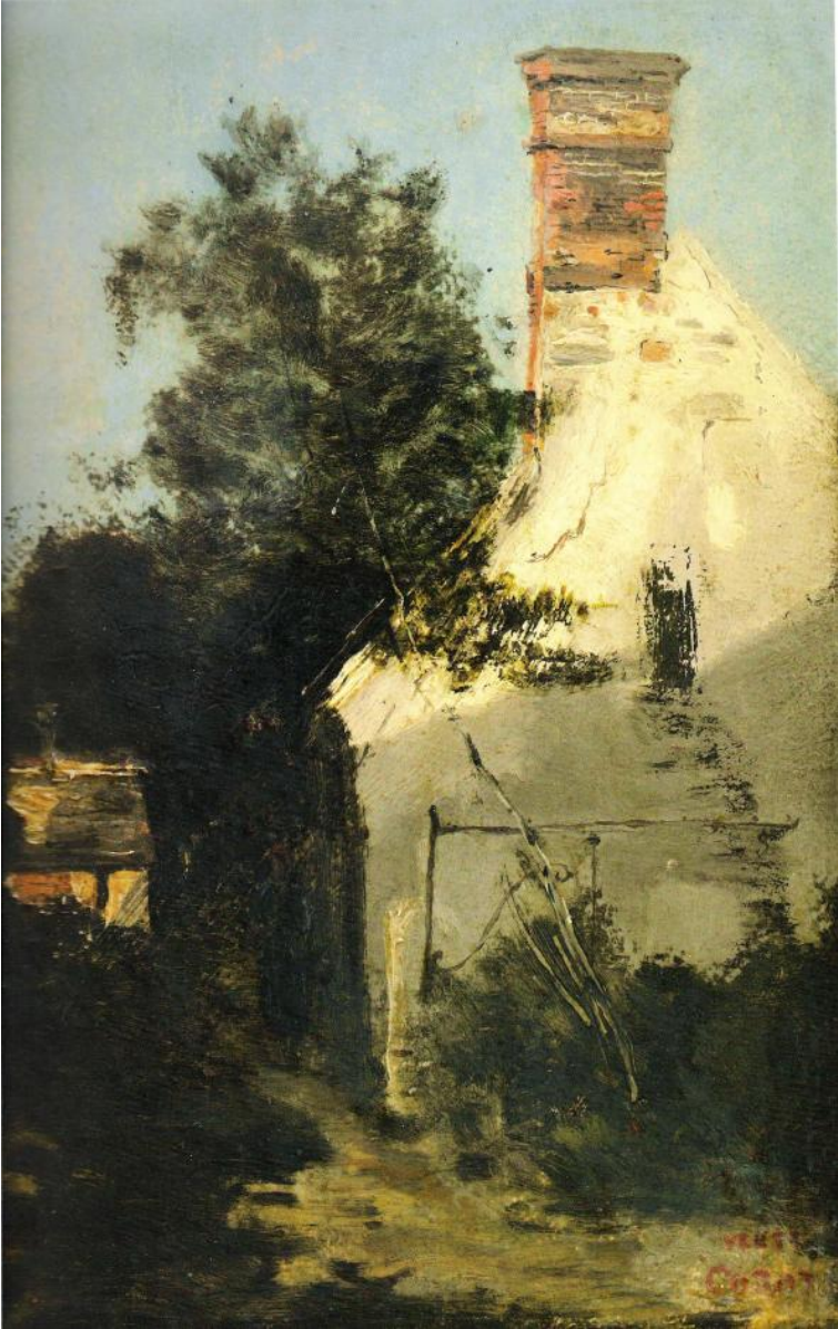
Camille Corot, Vue d'une maison