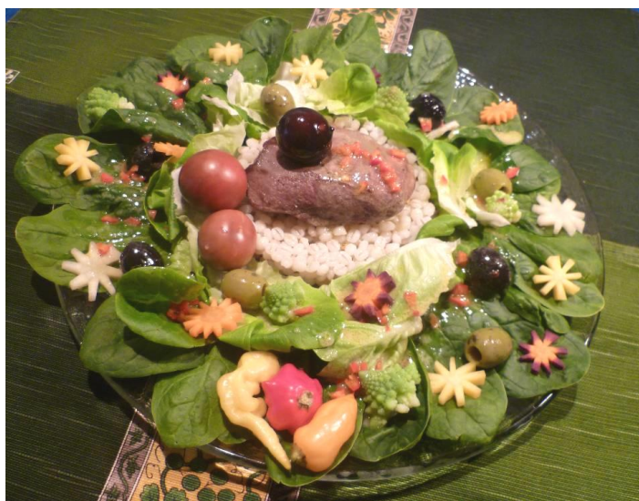
Salade verte et d'épinards et son chevreuil sur lit d'orge

Pour la sauce : coupez 1 piment en petits cubes, mélangez dans un bol la moutarde, 4 c.s. de vinaigre, 6 c.s. d'huile, sel, poivre et mélangez énergiquement. Versez la sauce sur les assiettes.