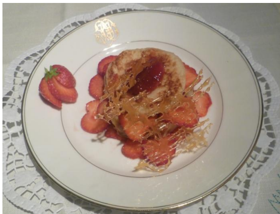
Pain perdu sur gaspacho de fraises et barreaux en caramel