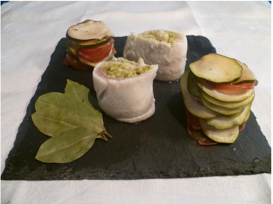
Ratatouille et filet de sandre aux olives

Coupez chaque poisson en deux et mettez-les debout sur une assiette. Faites deux « tours » avec la ratatouille. Pour plus de facilité, vous pouvez empiler les légumes dans un petit verre pas trop large, cela vous donnera un meilleur résultat.