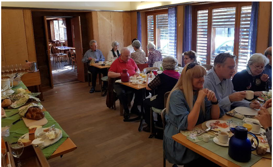
Une vue des participants au brunch.

En tout cas, personne n'a regretté son choix de participer à cette sortie agréable et la première fut appréciée.