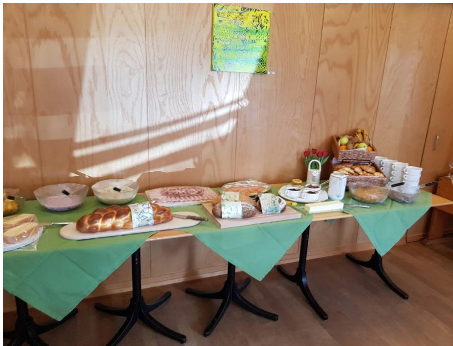
Une partie du buffet préparé avec des produits majoritairement régionaux.

est littéralement de me « faire cuire un œuf ». Faits à la minute et selon les désirs de chacun (brouillés, « 3 minutes », au plat, ...), ils ont été savourés par une majorité des participants.