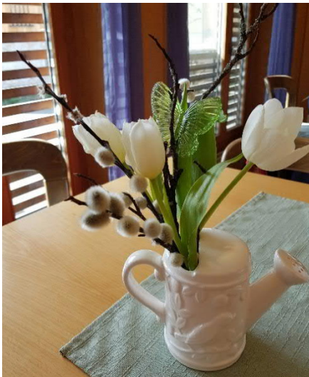
Les prémisses du printemps sur les tables

En ce magnifique dimanche ensoleillé du 8 avril, le Cercle Romand Winterthur s'essaie au brunch. A moins que mes souvenirs ne me trahissent, je ne me rappelle pas avoir déjà eu l'opportunité de participer à une telle activité de notre association. C'est donc avec une certaine curiosité que j'attendais cette nouveauté.